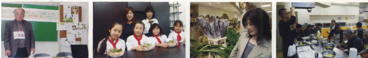
第5期はちおうじ志民塾 卒塾式